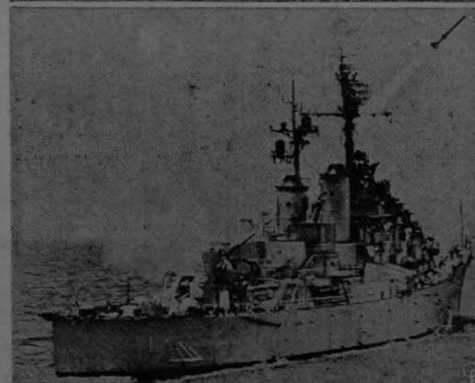
LA ARMADA MUESTRA SU PODERIO.—Un helicóptero HS-1 de la armada de Estados Unidos (arriba), suspende un equipo sonar en el mar, cerca del submarino Darter, en una demostración, en las afueras de Cayo Hueso, Florida, del último adelanto antisubmarino. Abajo, el U. S. S. Norfolk dispara un "Asroc" (cohete antisubmarino) a una media milla de distancia, en forma de arco. Luego el cohete descendió en paracaídas en busca de su blanco, un submarino atómico. La operación completa solamente tomó minuto y medio.